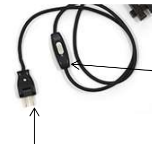
コンセントプラグ

・しっかり最後まで差し込んでください。 感電の恐れがあります。 キャップが180度動くので、家具の裏などの狭い場所でも壁にピッタリつけて使え、コードの配線もスッキリします。