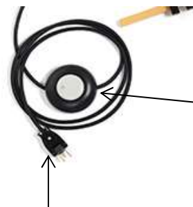
コンセントプラグ

・しっかり最後まで差し込んでください。 感電の恐れがあります。 キャップが180度動くので、家具の裏などの狭い場所でも壁にピッタリつけて使え、コードの配線もスッキリします。